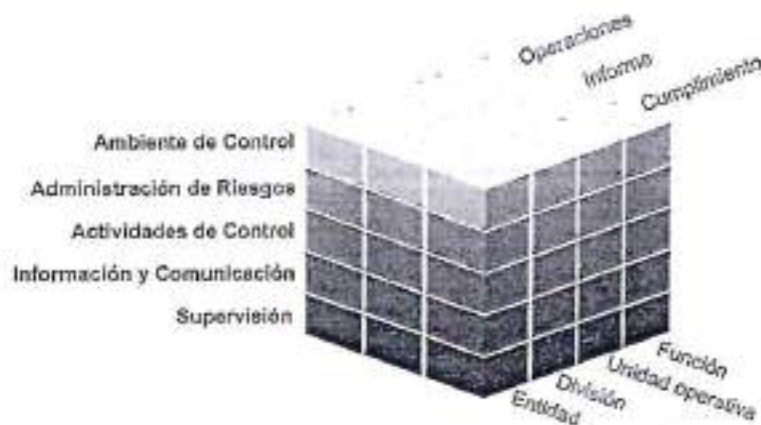
Esquema 1. Cubo COSO. Componentes.

La evaluación fue realizada a los cinco componentes del COSO: