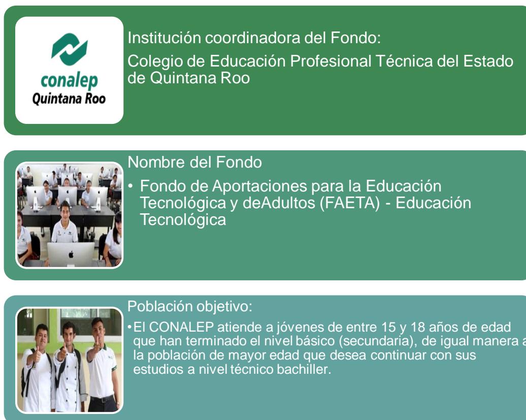
Figura 1. Características del Fondo de Aportaciones para la Educación Tecnológica (FAETA)

Fuente: Elaboración propia con base en Oficio No. Oficio No. OPD-Q.R.-DG-JPEI-317/2020